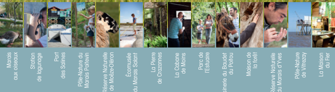
Marais aux oiseaux