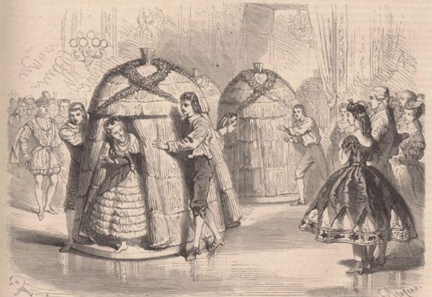
Épisode du bal costumé donné par S. M. l'Impératrice (ballet des abeilles, l'arrivée des ruches).

Le Radical , « loi féminicide », Hubertine Auclert, 17 novembre 1902