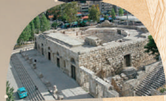
Odéon romain d'Amman en Jordanie